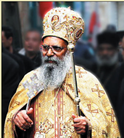
His Holiness Abune Mathias I (Patriarch and Catholicos of Ethiopia)

The Ethiopian Orthodox Church is one of the Oriental Orthodox Churches. Ethiopia is mentioned often in the Bible. The first person baptized into the Christian faith in the Acts of the Apostles was an Ethiopian Eunuch by St.Philip. Though Christian presence in Ethiopia from the first century A.D, Christianity became the state religion of Ethiopia in the fourth century A.D.